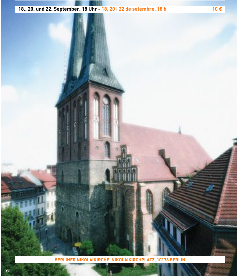
BERLINER NIKOLAIKIRCHE. NIKOLAIKIRCHPLATZ, 10178 BERLIN